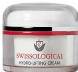
Swissological Hydro - Lifting Cream