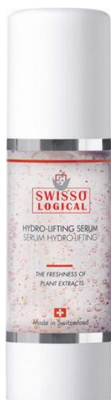
Swissological Hydro -lifting Serum

Produkter som DECLÉOR, MD FORMULATIONS och B I O T H E R M som används i traditionell behandling ger motsvarande effekt.